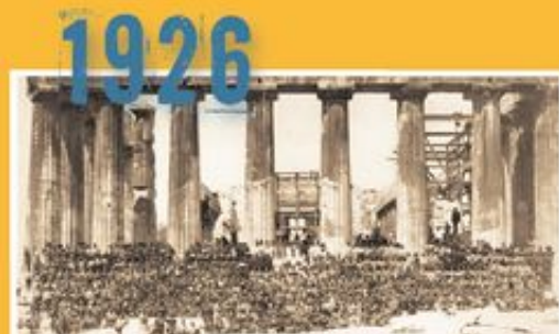
Η πρώτη πανελλήνια προσκοπική συγκέντρωση στην Αθήνα.