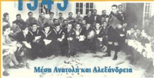
Μέση Ανατολή και Αλεξάνδρεια

Οι πρόσκοποι συνεχίζουν τη δράση τους στα πολεμικά πλοία του ελληνικού και συμμαχικού στόλου.