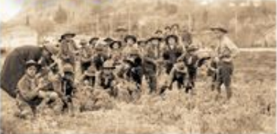
Δενδροφύτευση στο Άλσος Σωκράτους.