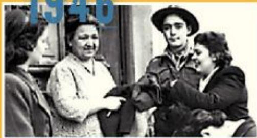
Έρανος για τη «Φανέλα του στρατιώτη».