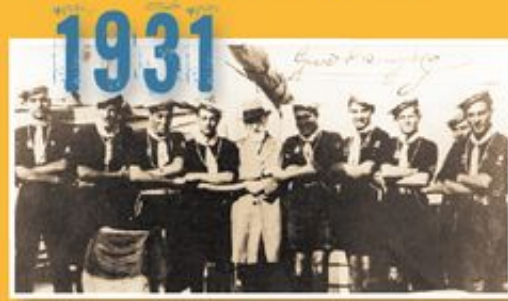
Ο Ελ. Βενιζέλος μαζί με την 3η Ομάδα Ναυτοπροσκόπων Αθηνών επιστρέφοντας από τη Γαλλία.