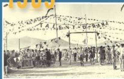
Στηγή από το 11ο Παγκόσμιο Προσκοπικό Τζάμπορν.