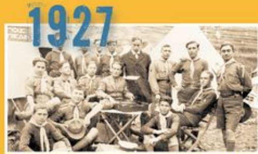
Οι πρόσκοποι συμμετέχουν στις Δελφικές Γιορτές προσφέροντας εθελοντική εργασία.