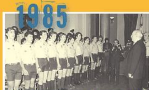
Ο Πρόεδρος της Ελληνικής Δημοκρατίας Κων. Καραμανλής στον εορτασμό των 75 χρόνων του Ελληνικού Προσκοπισμού.