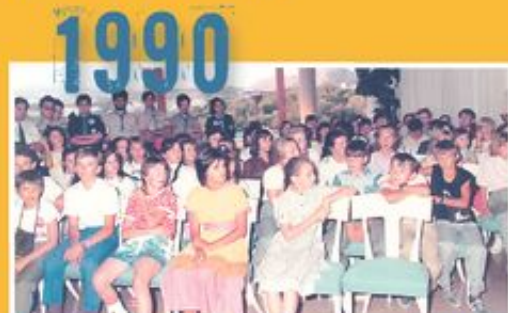
Κατασκήνωση για τα παιδιά του Τσερνομπίλ.