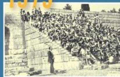
Κοινή δράση προσκόπων-οδηγών στα νησιά του Αιγαίου.