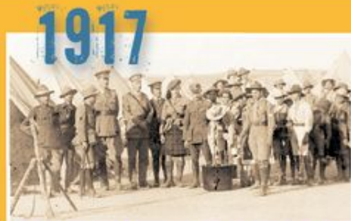
Οι πρόσκοποι προσφέρουν τις υπηρεσίες τους κατά την πυρκαγιά της Θεσσαλονίκης.