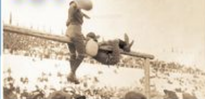
Η πρώτη μεγάλη προσκοπική επίδειξη στο Παναθηναϊκό Στάδιο.