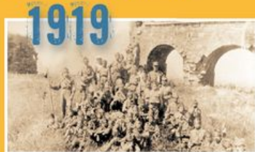
Οι πρόσκοποι του Αϊδινίου που σφαγιάσθηκαν από τους Τούρκους κατά κατάληψη του Αϊδινίου της Μικράς Ασίας.