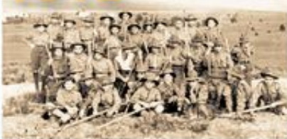
Οι πρώτοι Έλληνες Πρόσκοποι.