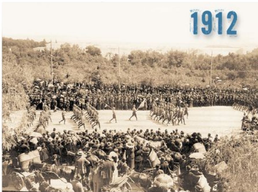
Η πρώτη δημόσια εμφάνιση των Ελλήνων προσκόπων στην παρέλαση της 25ης Μαρτίου.

Δίπλα στον Αθανάσιο Λευκαδίτη στάθηκαν σπουδαίοι και εξέχοντες άνθρωποι, όπως ο Κωνσταντίνος (Κοκός) Μελάς, ο Ι. Πανάς, ο Ν. Πασιπάτης, ο Φ. Χρυσοβελόνης και ο Μιλτ. Νεγρεπόντης, υπουργός αργότερα των Οικονομικών στην κυβέρνηση του Ελευθερίου Βενιζέλου, ως πρώτος πρόεδρος του νεοσύστατου