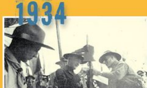
Ο Ιδρυτής του Παγκόσμιου Προσκοπισμού Lord Baden Powell απονέμει αναμνηστικό στο τότε ηγέτη της 4ης Αγέλης Ελλήνων Προσκόπων του Καΐρου.