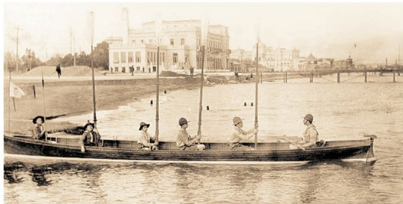
Μια από τις πρώτες ομάδες Ναυτοπροσκόπων.

Στην πρώτη αυτή περίοδο ο Ελληνικός Προσκοπισμός αναπτύσσεται και εκτός των ελληνικών συνόρων. Στην κατεχόμενη Θράκη, στην Κωνσταντινούπολη, στη Σμύρνη και σ' ολόκληρη τη Μικρά Ασία, στην Αίγυπτο, στην Αμερική (Νέα Υόρκη και Καναδά), στη Γαλλία, αλλά και σε κάθε κοινότητα του απόδημου Ελληνισμού.