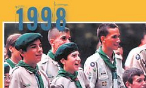
Πανελλάνια κατασκήνωση προσκόπων στη Σκωτία.