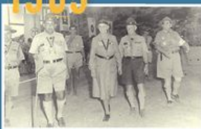
Η Λαίδη Όλαβ Πάουελ επισκέπτεται το 11ο Παγκόσμιο Προσκοπικό Τζάμπορν.