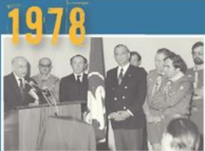
Ο πρώην Πρόεδρος της Ελληνικής Δημοκρατίας Κων. Τσάτσος εγκαινιάζει το κτήριο του ΣΕΠ.