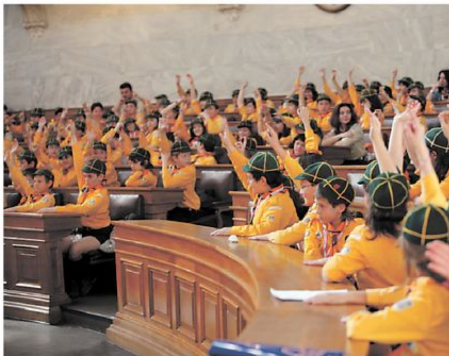
Πανελλάνια Συνάντηση Λυκόπουλων στην Αθήνα.

Τον Αύγουστο του 1963 οργανώνεται και πραγματοποιείται στο Μαραθώνα το 11ο Παγκόσμιο Προσκοπικό Τζάμπορν (Jamboree), με περισσότερους από 12.000 νέους απ' όλο τον Κόσμο. Την πρόσκληση προς όλα τα Εθνικά Σώματα Προσκόπων απύθυνε με μήνυμα του ο τότε Αρχιπρόσκοπος της Ελλάδος, Διάδοχος Κωνσταντίνος. Εξέχουσες προσωπικότητες σ' όλο τον Κόσμο θυμούνται ακόμα και σήμε-