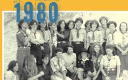
Ανιχνευτές στα Κουφονήσια.