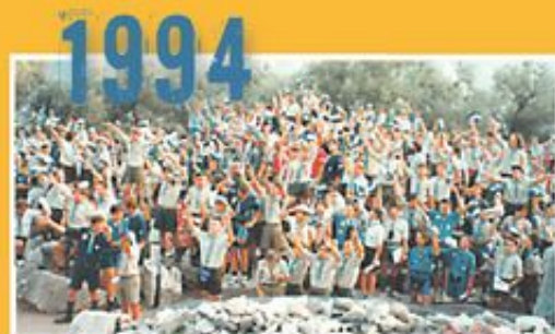
Πανελλάνια συγκέντρωση αντιπροσώπων του προσκοπισμού.