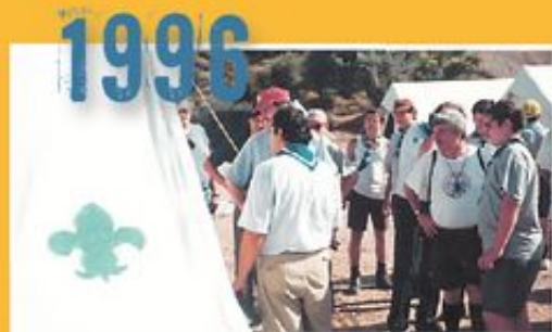
Ο Γιώργος Παπανδρέου μαζί με τους προσκόπους που προσφέρουν βοήθεια στους σεισμοπαθείς του Αιγίου.